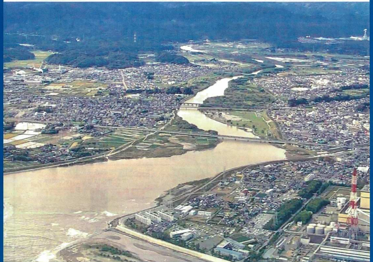
鮫川(河口部) 令和元年10月26日

この河川洪水ハザードマップは、福島県が作成した洪水浸水想定区域図に基づき、洪水・浸水の範囲や深さの予想と避難場所などを表示した「マップ」と、平时に確認や準備しておくことなどを記載した「情報」をまとめたものです。 ご家庭等の目のつくところに常備していただき、平时より災害に対する備えにご活用ください。