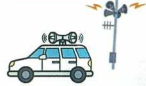
広報車・防災行政無線・水防信号